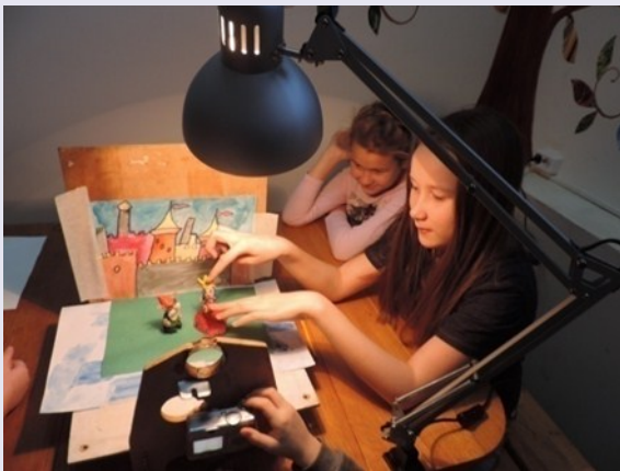
Сцена из мультфильма «Первый кот на луне»