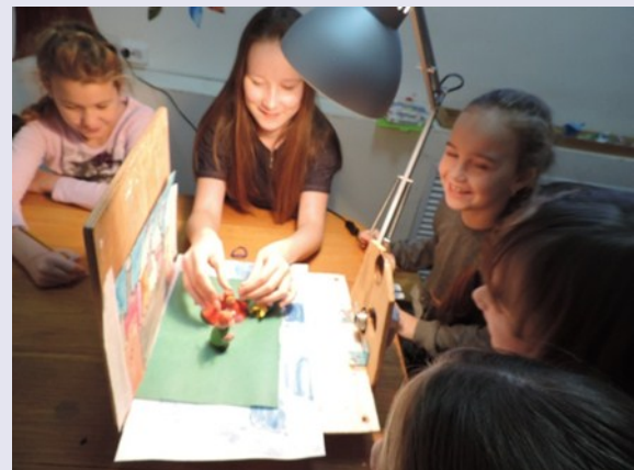
Сцена из мультфильма «Хвастливый мышонок»